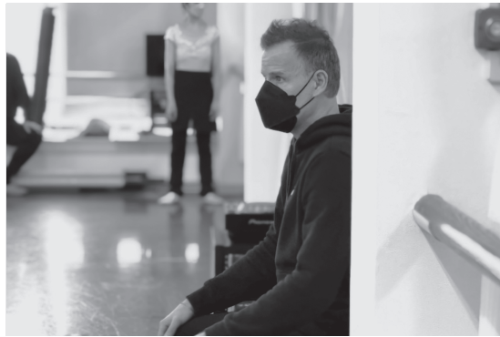
(貞松・浜田バレエ団)