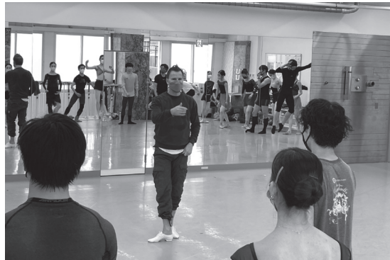
(東京シティ・バレエ団)