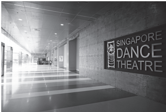
Bugis + 7階エレベーターホールから続く SDTの稽古場入口前スペースの様子

スウェーデン・ヨーテボリ出身。1971年カナダのロイヤル・ウィニペグ・バレエ入団、翌年米国ペンシルベニア・バレエに移籍。ワシントン・バレエやスウェーデン王立バレエ等でバレエマスターやバレエ教師を歴任したのち、2008年シンガポール・ダンス・シアター芸術監督に就任。