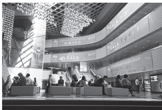
「香港芸術文化中心」のエントランスホール (公演前のパフォーマンスにも使用されていた)